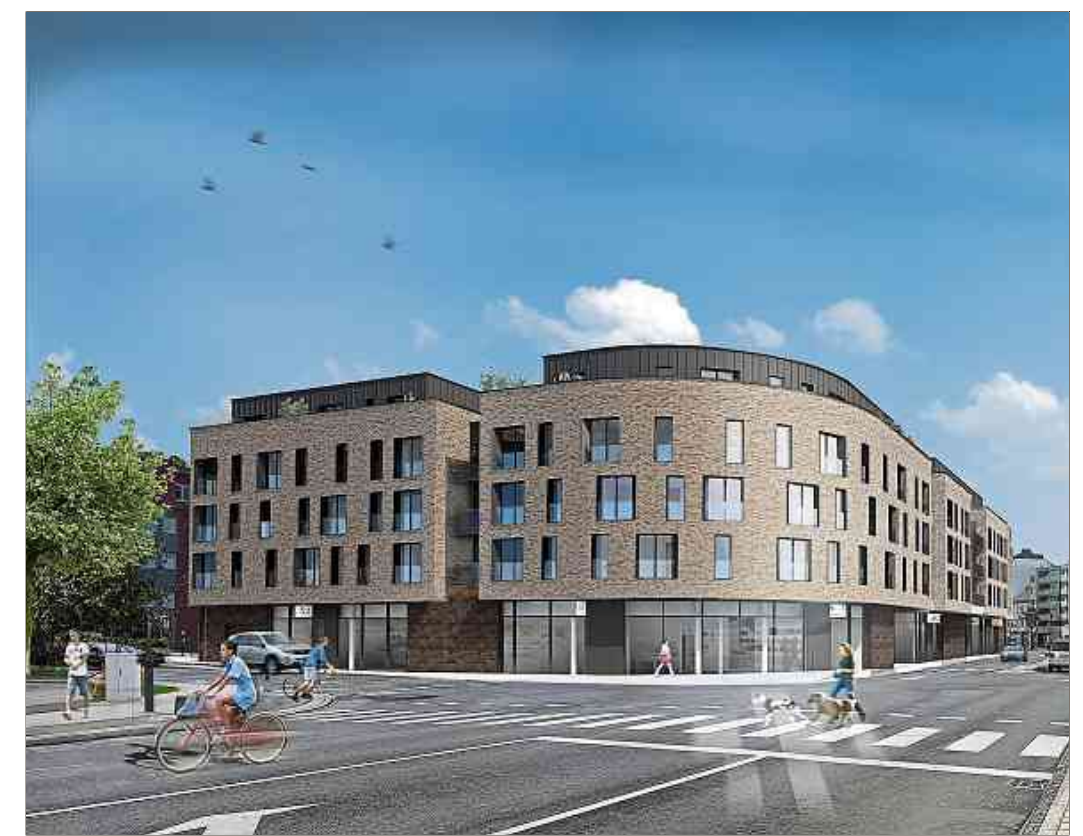
Themis, l'ensemble immobilier, est intégré de façon harmonieuse en plein cœur de l'ancienne ville.