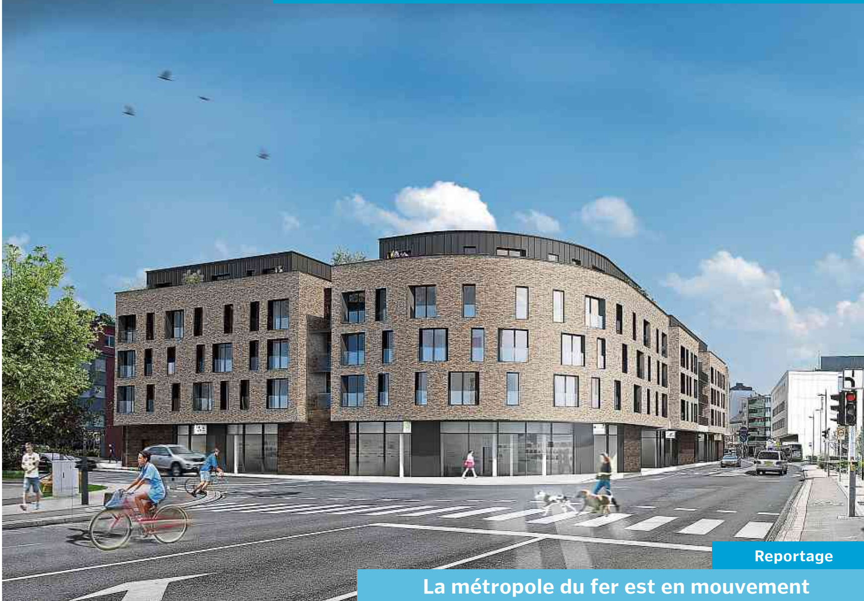
Reportage La métropole du fer est en mouvement

Supplément Bauen&Wunnen Fenster und Türen