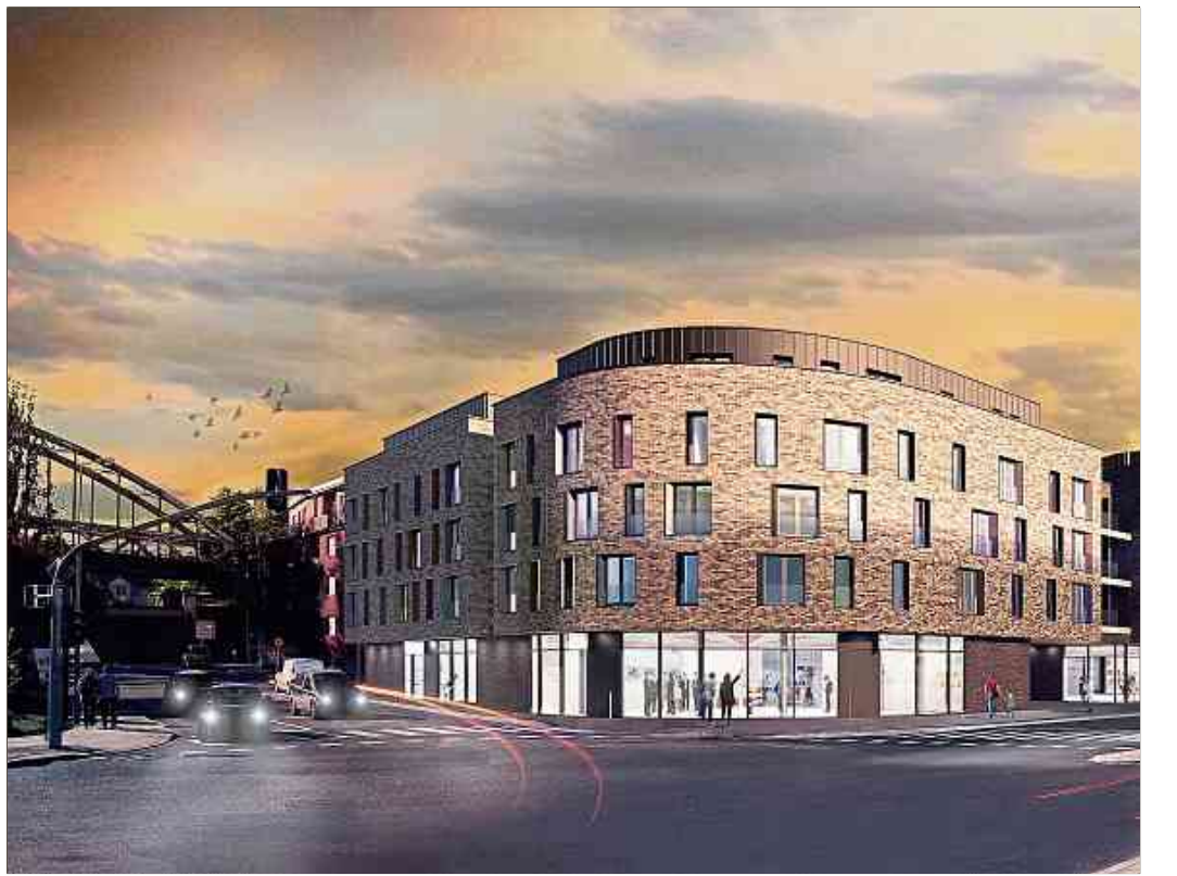
Le complexe mixte Themis, en face de la nouvelle cité judiciaire.

tentiel de 1.500 unités de logement à long-terme. Des projets immobiliers qui révolutionnent les quartiers Le projet «Nonnewisen» dans le quartier «Zaepert» vise, quant à lui, à intégrer une nouvelle façon de voir l'habitation moderne et citadine. «Wunnen am Park», réalisé par la Ville d'Esch-sur-Alzette et le Fonds pour le développement du logement et de l'habitat, offre à ses habitants des logements de haute qualité dans un environnement agréable, bordé d'espaces verts et situés à proximité directe du centre-ville. «Équipé d'infrastructures publiques