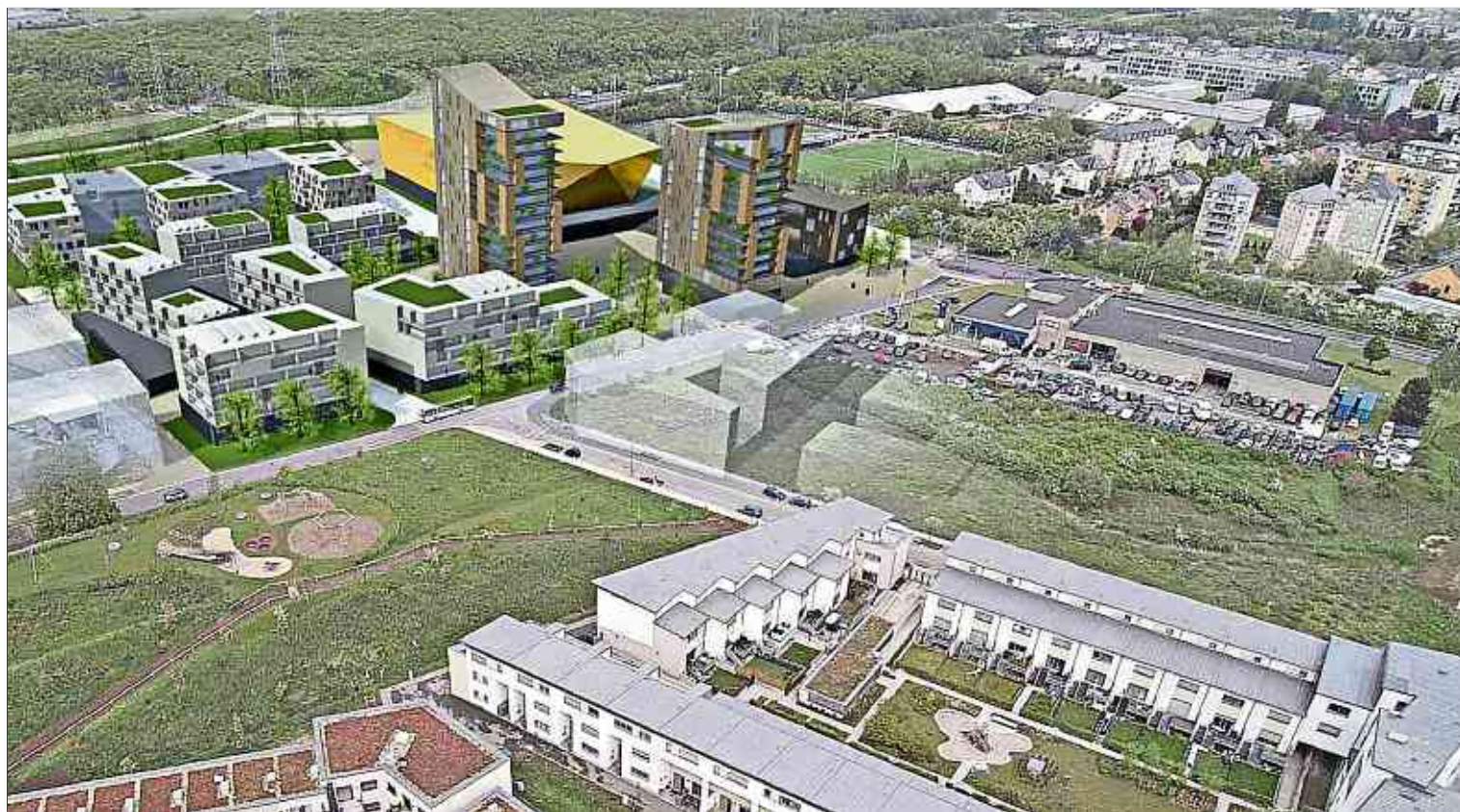
Das Projekt ist auf dem Areal zwischen Kontrollstation und Pénérante de Lankelz angesiedelt. Dort, wo die (hier goldene) Sporthalle geplant ist, befindet sich heute ein BMW-Autohaus. (GRAFIK: TRACOL / WEISGERBERARCHITECTE)

Letztere sei das Herzstück des Ensembles, so Architekt Louis Weisgerber. Zu erfahren war auch, dass die Sporthalle durch die Abgabe von Grundstücken finanziert werden soll. Das Areal, wo derzeit das BMW-Autohaus ist, (das in die Industriezone „Um Monkeler“ ziehen wird), stellt die Stadt dem Bauherrn zur Verfügung. Dieser baut dafür die Sporthalle samt